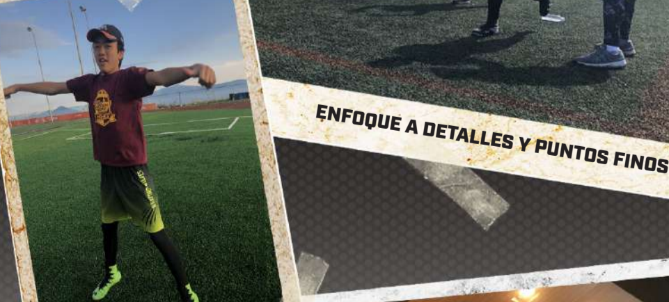
ENFOQUE A DETALLES Y PUNTOS FINOS