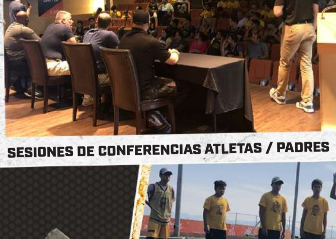
SESIONES DE CONFERENCIAS ATLETAS / PADRES